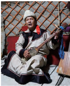
トールチ(モンゴル)