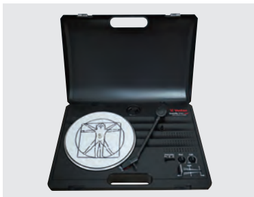
ターンテーブル(日本) | 個人蔵