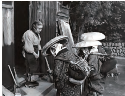
警女の門付け(日本)