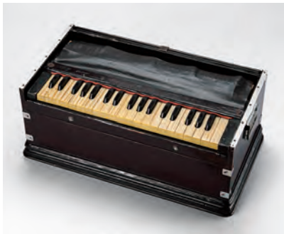
ハルモニウム(インド) | H0276625 | 国立民族学博物館蔵