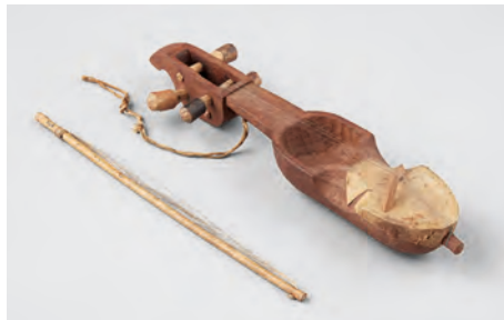
サーランギ(ネパール) | H0000238 | 国立民族学博物館蔵

ライブ・パフォーマンスや映画会など 胸が高鳴るイベントが盛りだくさん! さあ、みんなで吟遊詩人の世界へ! →→→