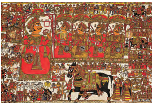
ラージャスターンの宗教画(インド) | H0104328 | 国立民族学博物館蔵