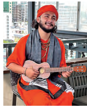
都市のパウル歌手(バングラデシュ)