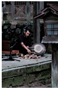
語り部/ラッパー 志人(しびと)(日本)