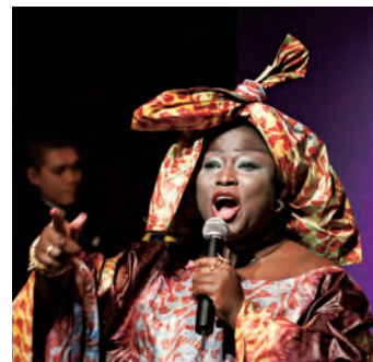
グリオの歌手ニヤマ・カンテ(ギニア)