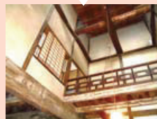
← 斎藤真一作品 鑑賞