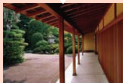
数奇屋建築と庭園