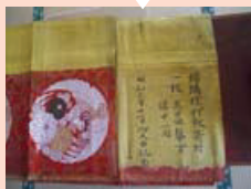
瞽女組合奉納の打敷